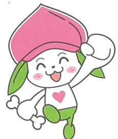
協会けんぽ福島支部マスコットキャラクター ケンタくん